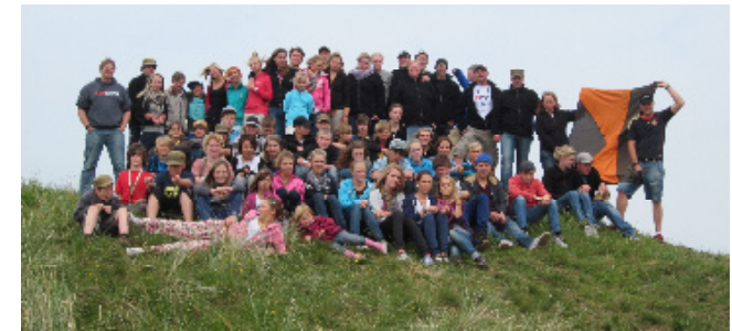
Teilnehmer Ferienlager 2011

Für den Auf- und Abbau unseres Zeltlagers sind interessierte Väter, die bereit sind mit nach Ameland zu fahren, gerne gesehen.